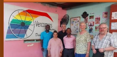
Overcomers by Grace