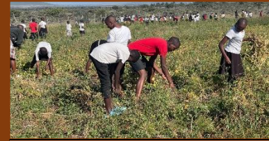
Mara Silalei Academy